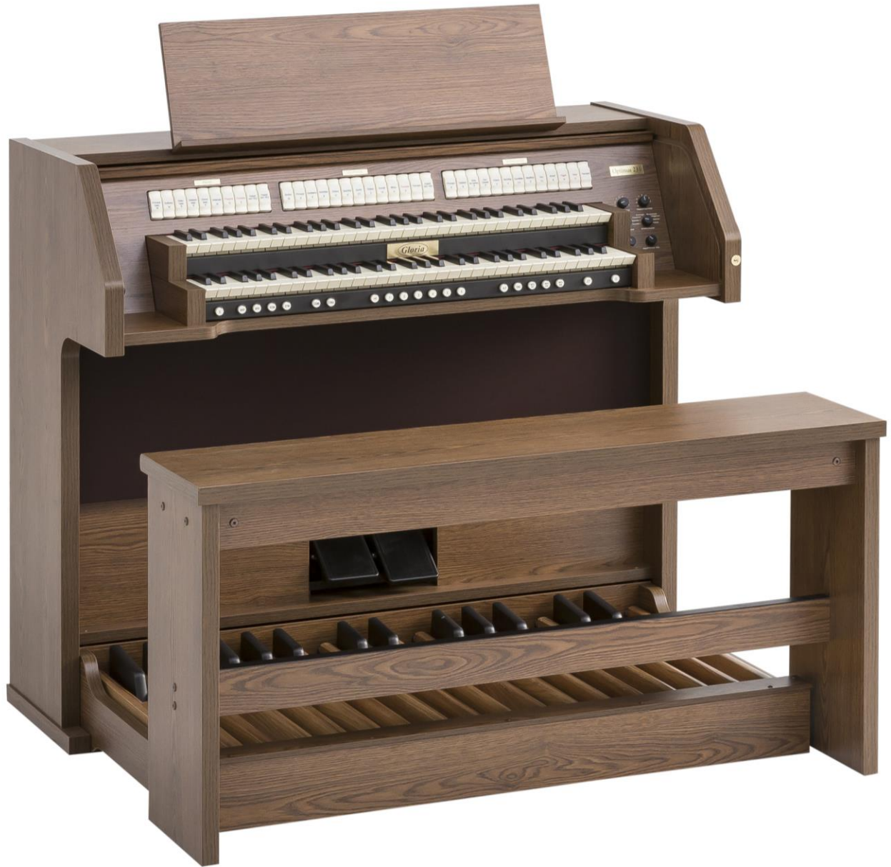
Gloria Cantus 2.31 Gehäuseausführung Eichedekor dunkel