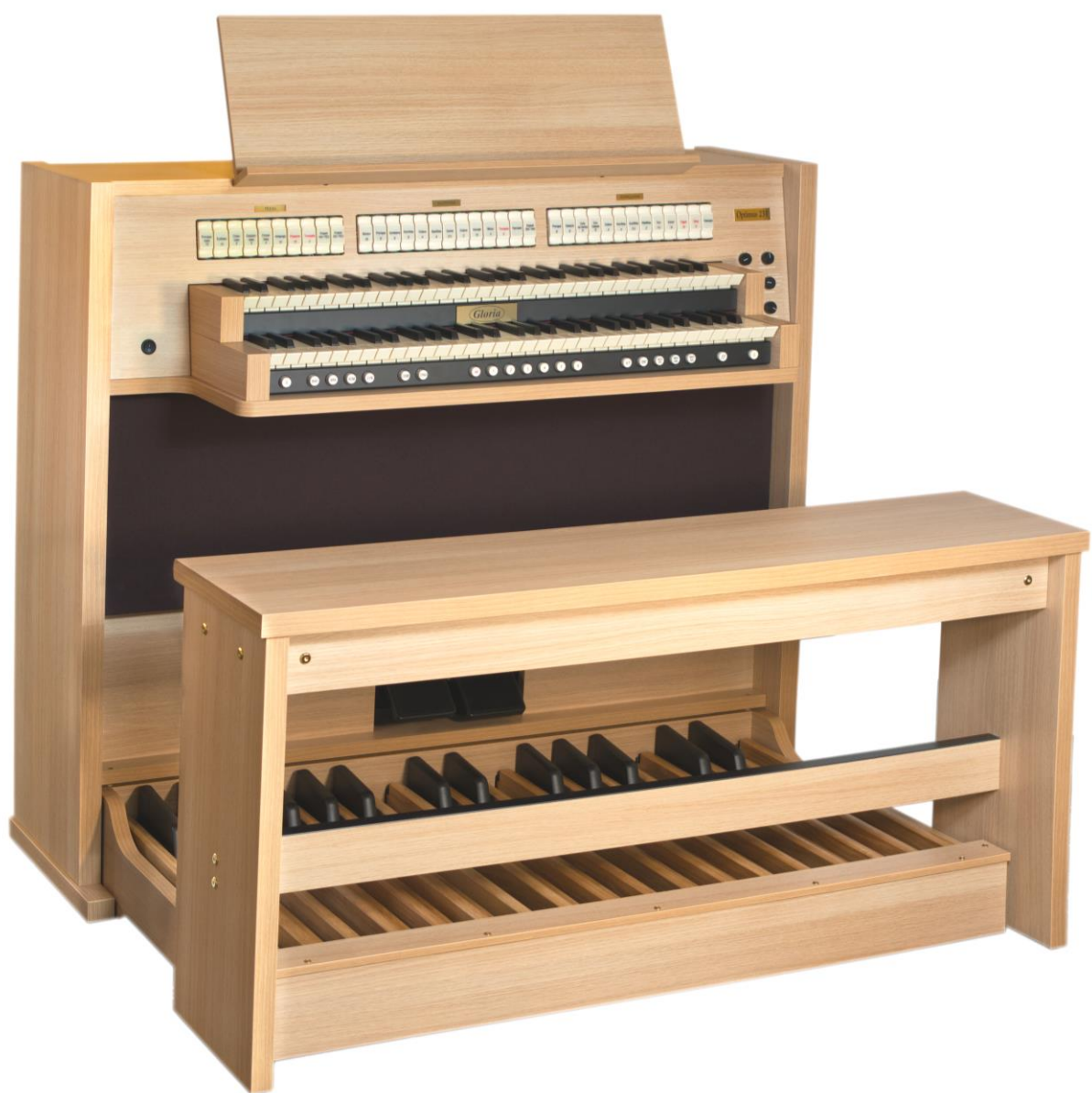
Gloria Cantus 2.31 Trend Gehäuseausführung Eichedekor hell